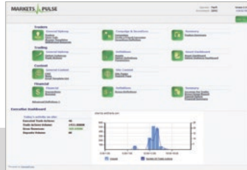
マーケットパルス ( Markets Pulse) のバックオフィス