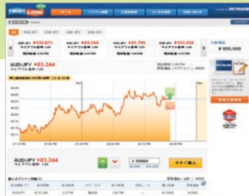
FXTrade Japan が運営するバイナリー・オプションのサイト